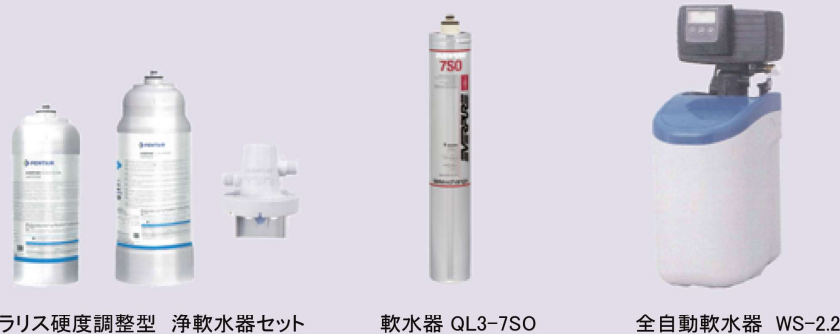
クリス硬度調整型 浄軟水器セット