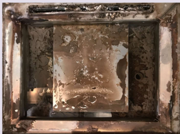
スケールが付着した水槽の例

ドライスチーマーのトラブルの多くは水道水の水質による「スケール」の付着が原因で起こる場合が多く、設置の際は一次側に軟水器または自動軟水器の取り付けをおすすめします。(別売)